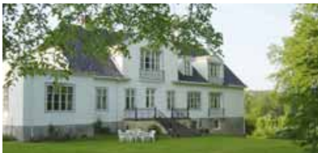
Grønli Gård

Hovedbygningen på Grønli gård er bygget ca 1830, og den ble bygget om i jugendstil i 1905. Dette er det mest karakteristiske jugendhus i Moss hvor også interiørene med møblering, rombehandling, William Morris tapet og gardinoppheng er bevart.