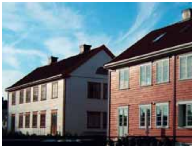
Bråten gata.

I tillegg er en rekke enkeltbygninger tatt vare på gjennom reguleringsplaner og sentrumsplanen. 3 I planarbeidet har vi lagt som forutsetning at alle disse områdene videreføres og bygget videre på i eksisterende planer.