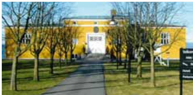
Jeløy Radio

Jeløy Radio ble anlagt i 1931 og utvidet i 1934 og 1956. Aktiviteten ble lagt ned i 1998. Bygningen er ominnredet til kurs og konferansesenter for Telenor, men noe teknisk utstyr er bevart dels i stasjonen dels i museet som er innredet.