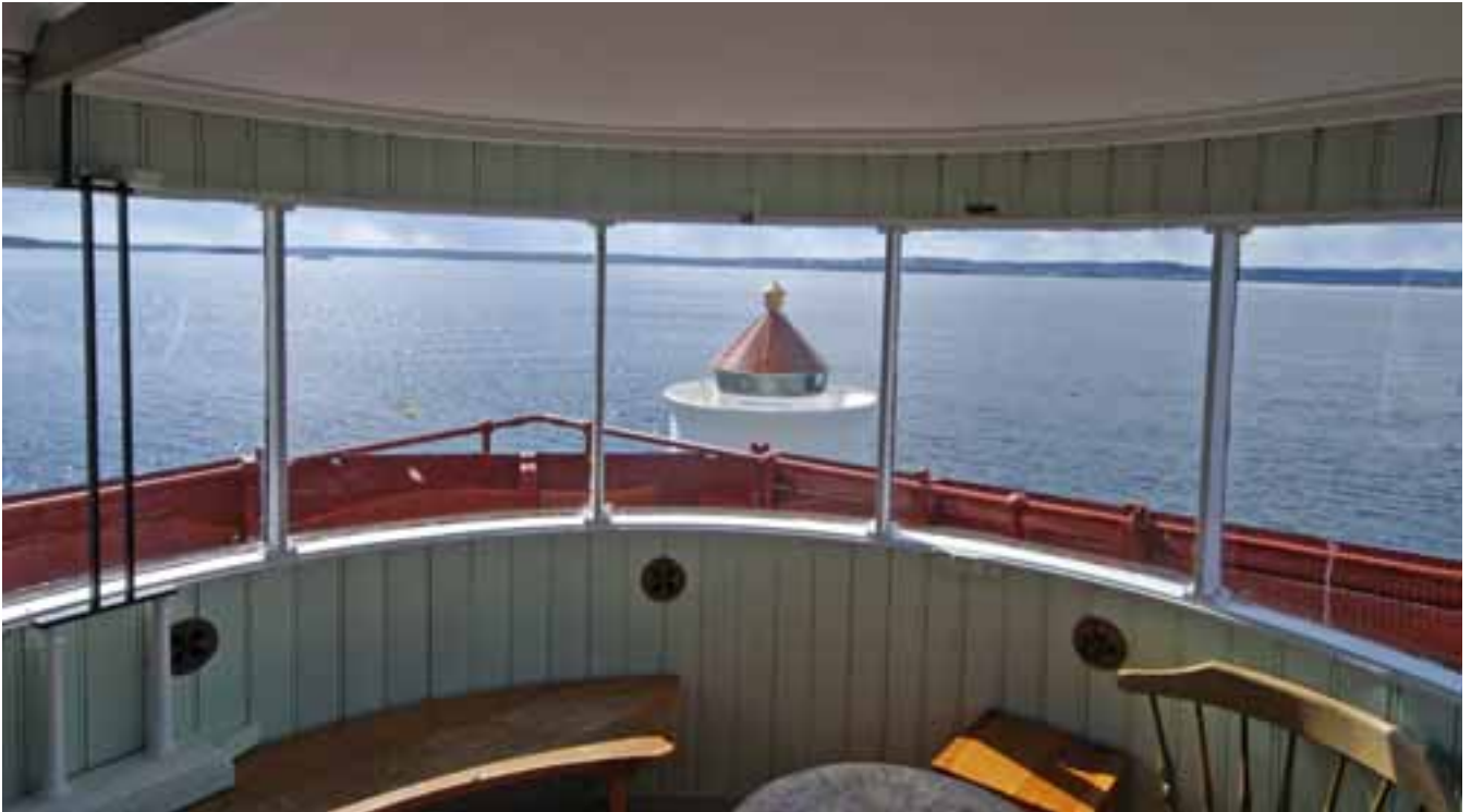
Gullholmen fyr.