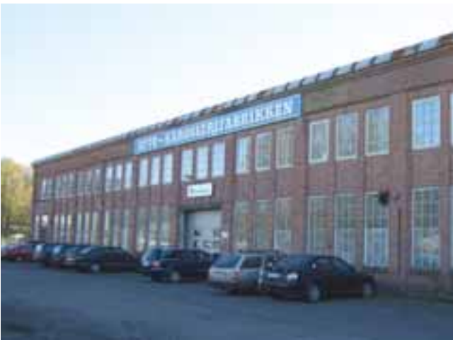
Kambo Karosserifabrikk

Dette er Norges eneste anlegg oppført for bilproduksjon og ble reist i 1917 for Norsk Automobilfabrik A/S. Området består av 4 fabrikkbygninger i teglstein. Anlegget er unikt og har stor bevaringsverdi og ønskes bevart etter Plan- og bygningsloven.