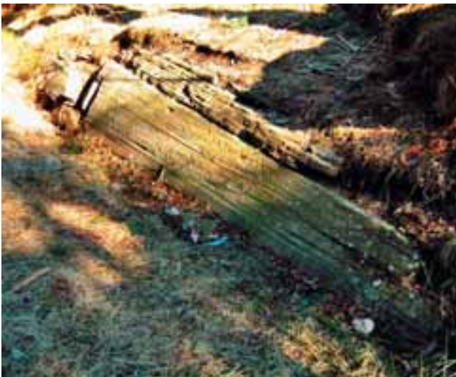
Helleristning, Ramberg, Foto: Aage Olsen

Helleristning, boplasser (steinalder), hulveier, gravrøyser (bronsealder/ jernalder), bygdeborg, huler