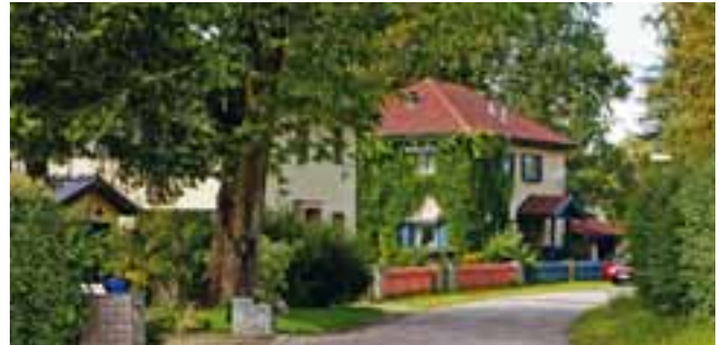
Thorneløkka