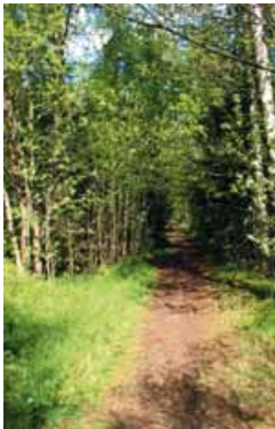
Gamle Kongevei

Etter at jernverket i Moss startet i 1704 vokste behovet for kull enormt i Mossedistriktet, og