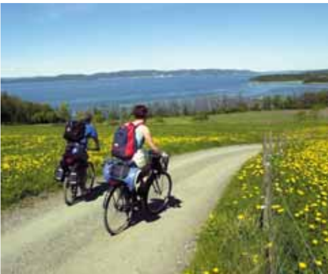
Ramberg JIF NYTT

I denne planen er området definert som et belte på tvers av Jeløy, fra Mossesundet med Rosnes og Kjellandsvik i øst, til den åpne fjorden med Refsnes, Ramberg og Fuglevik i vest.