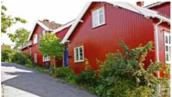
Klommestenasen, foto: JEW

Området ligger på en fjellknaus med små gater og smug. Bebyggelsen består av småhus som er oppført i ulik stil og form, med og uten uthus og bakgårder. Men i sin ulikhet, fremstår det allikevel som et enhetlig boligområde fra 1. halvdel av 1900-tallet.