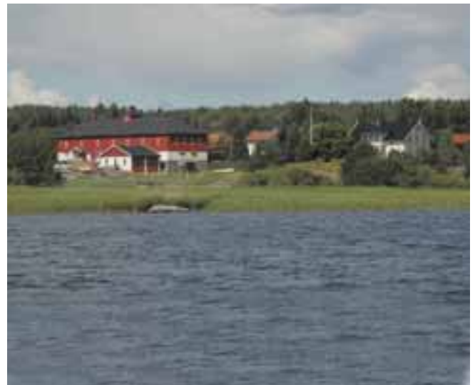
Vanem gård

Vanem gård utmerker seg med svært karakteristisk og herskabelig bebyggelse og beliggenhet med utsikt mot Vansjø. Den store hovedbygningen i sveitserstil fra 1884 er rikt dekorert.