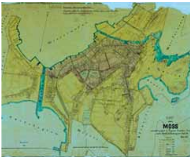
Kart over Moss 1879

Fra 1864 ble Vansjø regulert ved Krapfoss, men dammen ble flyttet i 1886 til Sponvika. Her lå reguleringsdammen frem til 1942 da den ble flyttet til sin nåværende plass ved Klova ved Mossefossen. I 1973 ble Vansjø-Hobølvassdraget vernet mot ytterligere kraftutbygging og reguleringer.