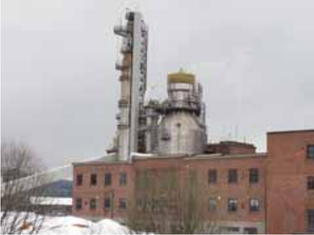
Peterson & Søn