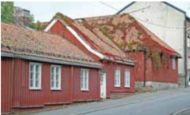
Verket, foto: JEW

Verket er et ensartet og enestående område av arbeiderboliger fra 1700-tallet i tilknytning til Konventionsgården. Konventionsgården er fredet av Riksantikvaren og eieren, Høegh Eiendom as, har planer om å utvikle bygningen i forhold til utadrettet bruk som er forenlig med de historiske begivenheter. Konventionsgården var hovedbygning på Moss Jernverk og ble brukt under fredsforhandlingene mellom Norge og Sverige og underskriving av Mossekonventionen den 14. august 1814.,