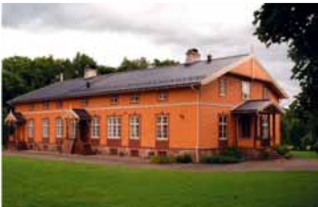
Kambo gård

Gården har vært bebodd fra 1500-tallet og er eneste herregård i Moss. Den har ligget strategisk inntil Kongeveien mellom Christiania og København. Hovedbygningen ble oppført i 1704 på en gammel grunnmur fra 1604, kalles i dag "gamlegården". Ny hovedbygning i sveitserstil ble reist i 1847, som er et av de eldste sveitserhusene i Østfold i dag. Gården er bebodd og i drift.