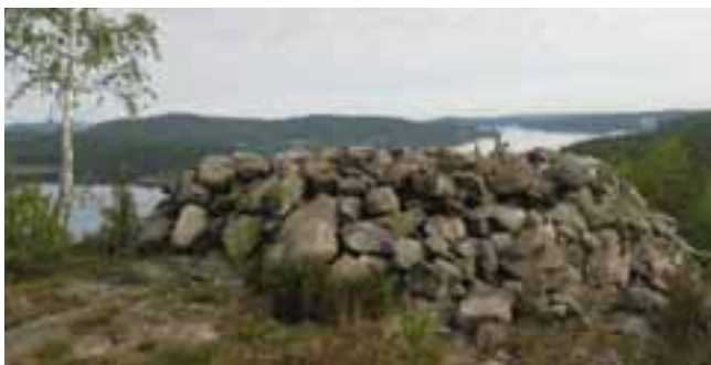
Gravrøys, Røysåsen

I Mosseskogen finnes en rekke fornminner og nyere kulturminner. Fornminnene er automatisk fredet, men har behov for registrering, kartfesting og merking. En strekning av Kongeveien fra 1600-tallet går gjennom Mosseskogen.