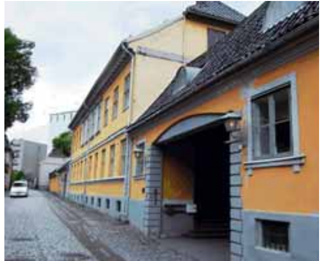
Bryggeriet, Henrich Gerners gate.