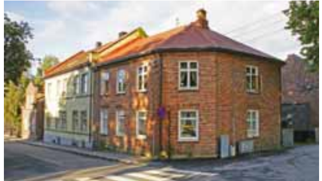
Bjerget, søndre

Området består av søndre- og nordre Bjerget, som er et boligområde fra 1800-tallet. Nordre del er eldst med bygninger fra 1820-tallet, men mange av de eldste husene er revet. Søndre del består av sveitserhus fra århundreskiftet og fremstår som et enhetlig og godt bevart område.