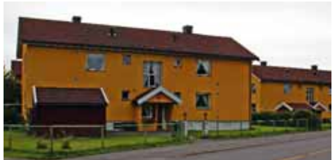
Carsten Ankers gate

Dette er Moss Boligbyggelags første leiligheter fra 1949. Området består av 6 like murhus som hver inneholder 4 leiligheter. Boligområdet er et godt eksempel på boligbyggingen på 1950-tallet.