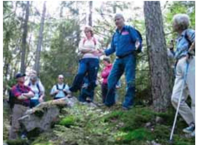
Elvevandring med Moss Historielag.

Det kan være naturlig å inngå partnerskapsavtaler mellom Moss kommune og lokale foreninger om skjøtsel av kulturminner og formidling av lokalhistorie. Jfr kap 9. 8