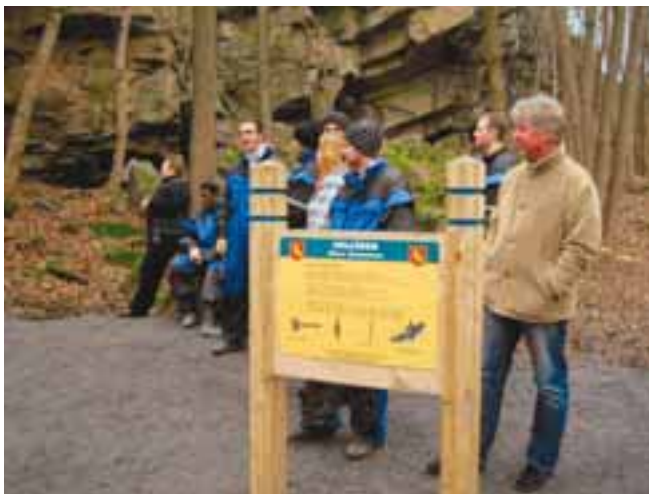
Helleren på Gjerrebogen

I Moss er det registrert en rekke fornminner som er lagt inn i Riksantikvarens database/kart Askeladden. Det foreslås at Moss kommune tar initiativ overfor Fylkeskonservator for å få versifisert andre registrerte fornminner og at det i samarbeid med Moss kommune lages en plan for registrering og merking.