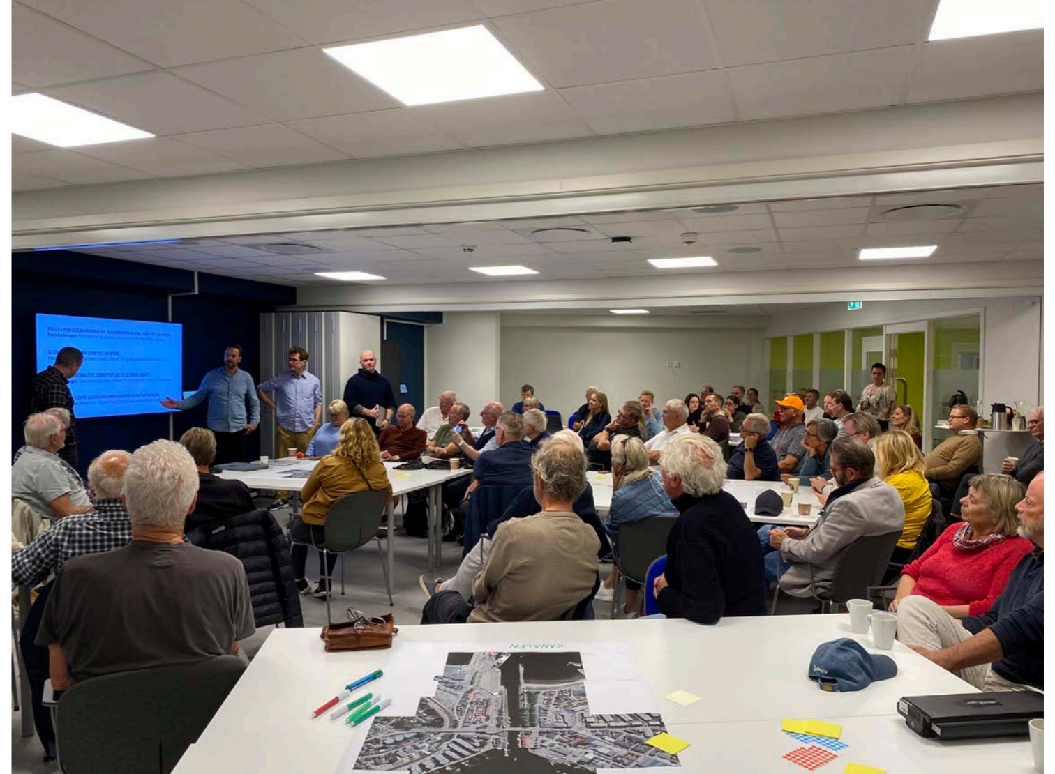
Teamene presenterte seg og hvilket scenario de skulle ta for seg, men ingen egne arbeider i denne runden