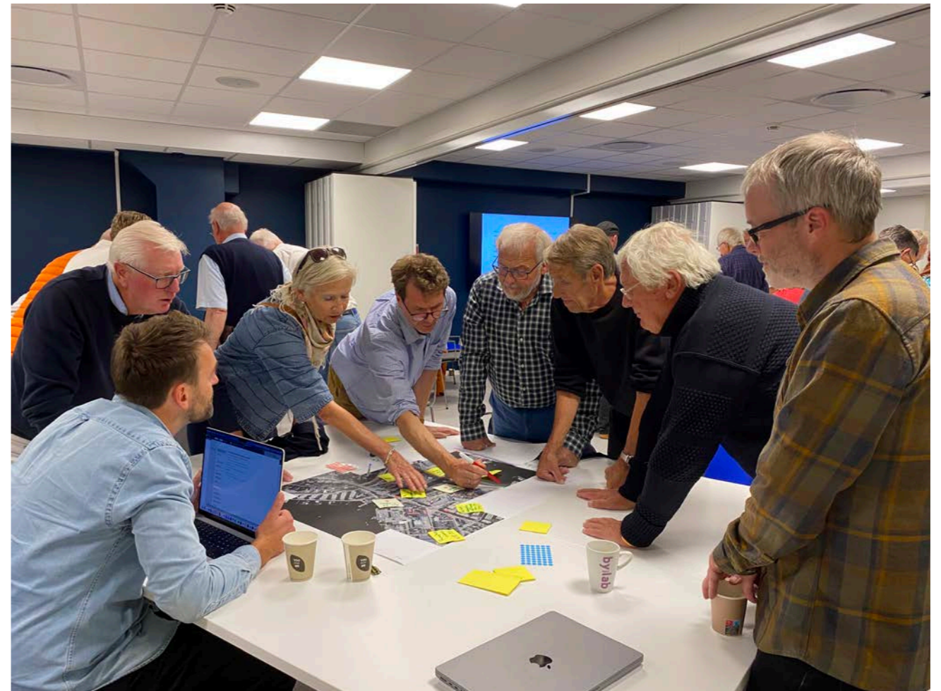
PARALLELLOPPDRAG MOSS ROCK CITY! INNSPILL FRA FOLKEMØTE 12.09.2024