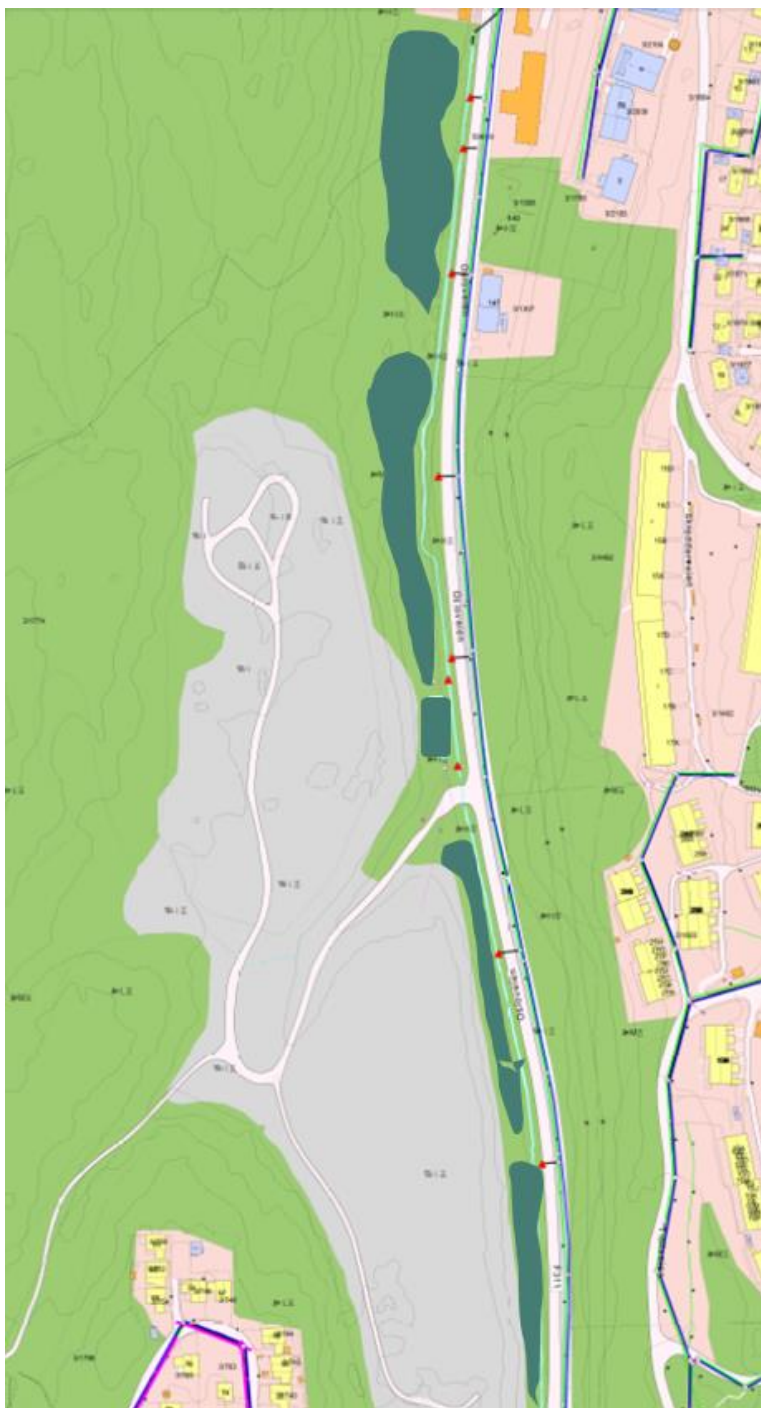
Figur 3. Trolldalen rensepark: Forslag til utvidelser av Trolldalsbekken sør og nord for det foreslåtte nye renseanlegget som ligger på østsiden av den nordlige delen av deponiet. Disse dammene kan fange opp noe diffus avrenning fra deponiet, men inngår ikke i renseanlegget.