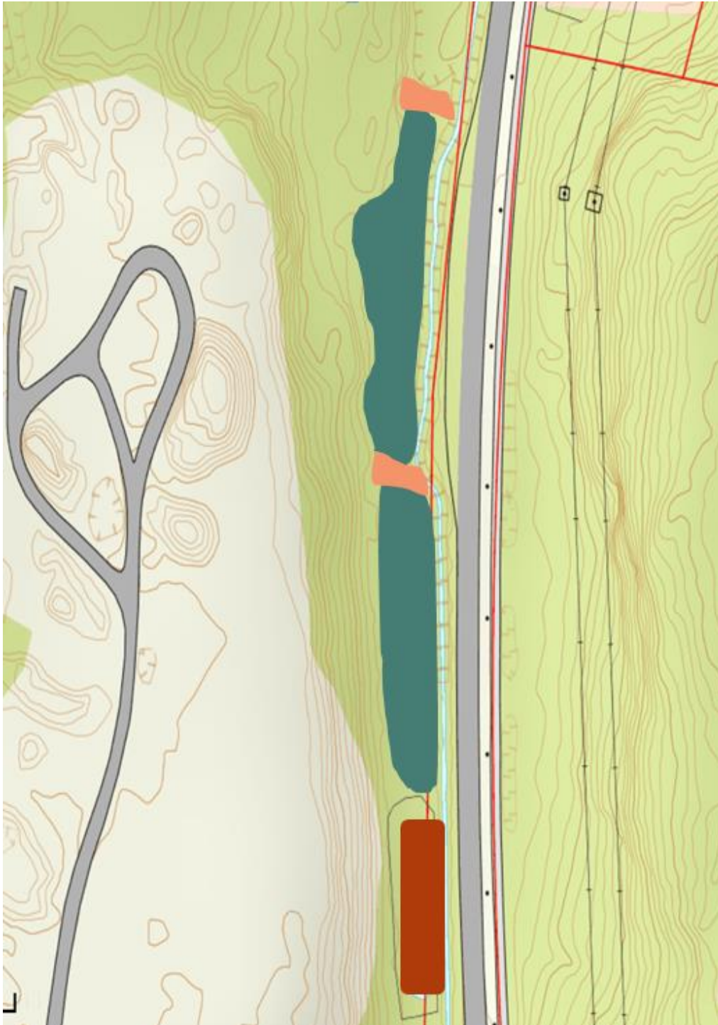
Figur 2. Luftet lagune og sedimentering (rød farge, ca. 400 m 2 ) etterfulgt av en eller to grunne våtmarksbasseng i hele deponiets lengde (grønn farge, ca. 2000 m 2 ).