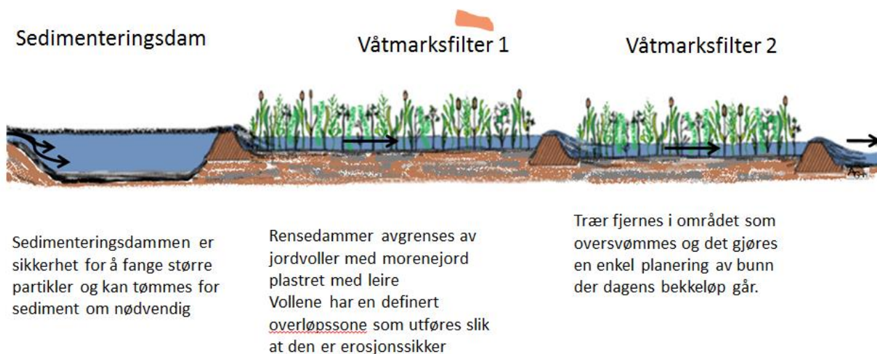
Figur 1. Prinsippskisse av rensanlegget etter dam med lufting